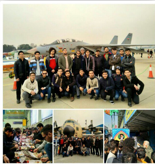
بازدید از فرودگاه مهرآباد برنامه چهارم راه جامع مهندسی