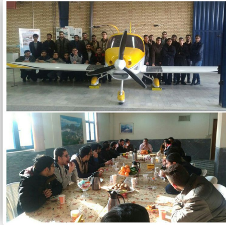
بازدید از مجموعه هوایی دریا برنامه سوم راه جامع مهندسی