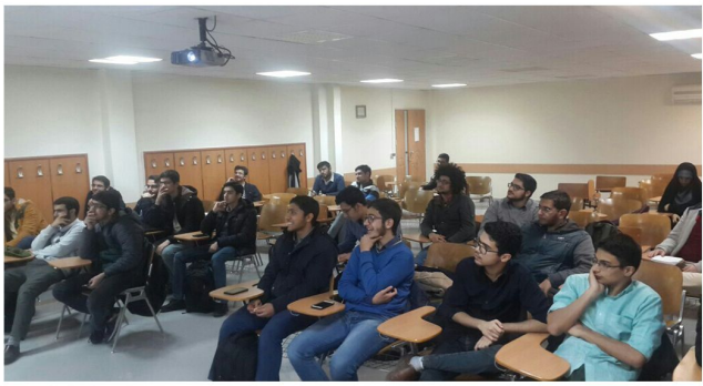
کارگاه آموزش انتخاب واحد