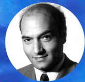
دکتر علی شریعتی

چه هوشیارانه دگرگون کرده اند پیام امام حسین را و باران بزرگ و عزیز و جاویدش را پیامی که خطاب به همه انسان هاست. پس از این که امام حسین همه عزیزانش را در خون می بیند و جز دشمن کینه توز و غارتگر در برابرش نمی بیند فریاد می زند «هَلْ مِنْ نَاصِرٍ يَنْصُرُنِي...؟» مگر نمی داند که کسی نیست که او را یاری کند این سؤال، سؤال از تاریخ فردای بشری است و این پرسش از آینده است و از همه ماست.